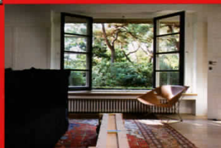
Contemporain : chez le créateur de la marque Bellerose page 78