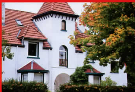
Gros-plan : Waterloo, nouveau centre d'intérêt immobilier page 104