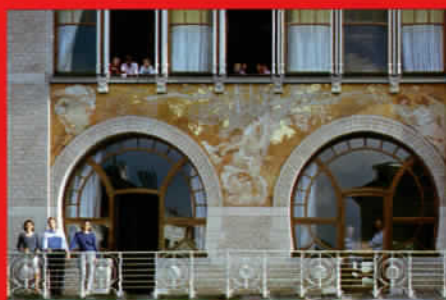
Art nouveau : la rénovation d'un bijou signé Paul Hankar page 70

Une famille française dans une maison Art nouveau, la villa du créateur de Bellerose, les quartiers de Waterloo: tous les styles sont permis